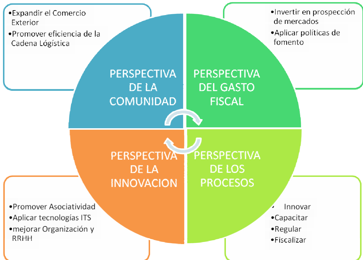
Figura N° 3 Estrategia nacional del transporte internacional de carga

La lectura de la estrategia es la siguiente: